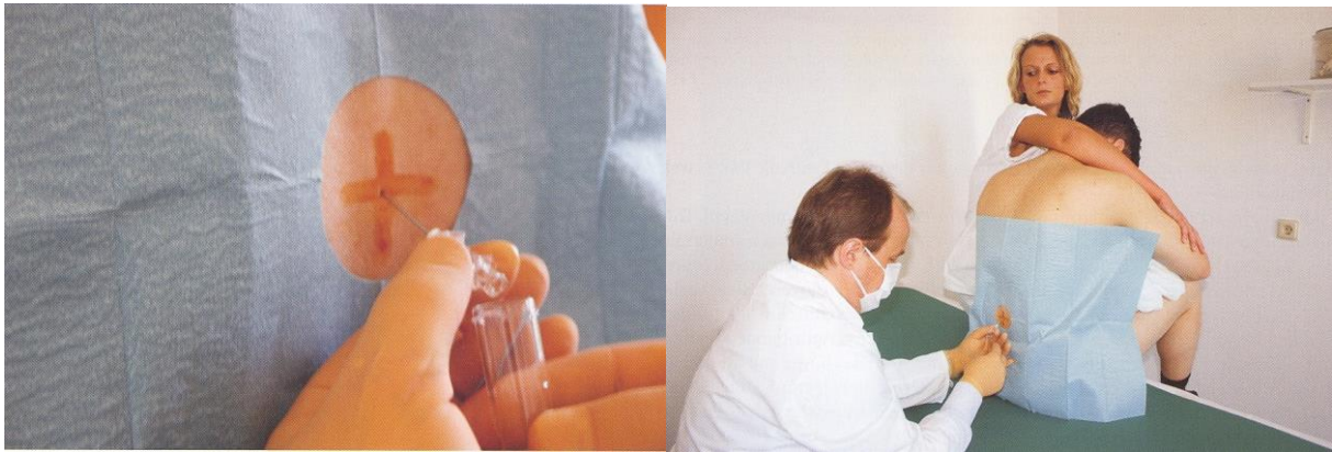
Slika 2: Lumbalna punkcija v sedečem položaju

Včasih se zdravnik odloči za lumbalno punkcijo v sedečem položaju. Položaj je neprijetnejši za bolnika, zdravnik pa v tem položaju bolje otipa trne ledvenih vretenc preiskovanca in lažje opravi preiskavo. Preiskovanec sedi sklonjen naprej z nogami čez rob preiskovalne mize (Slika 2).